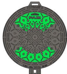
Upper and lower segment