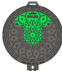
Upper and middle segment